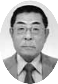
同窓会会長になつて