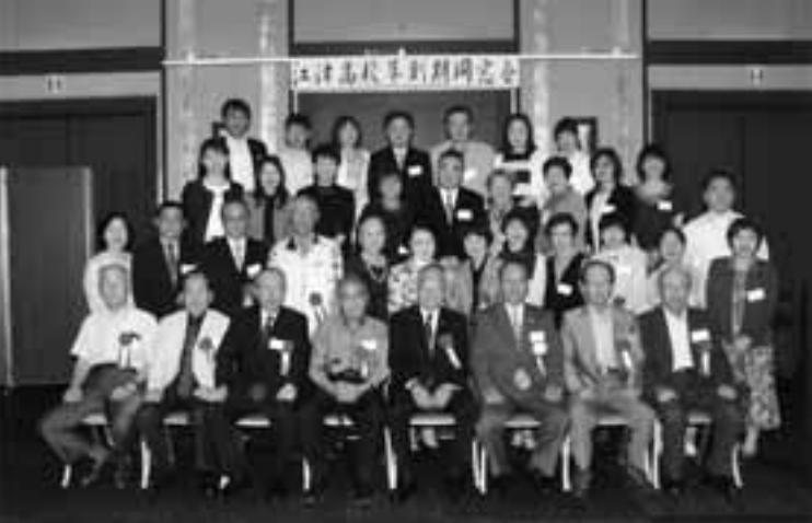
江津高校草創期同窓会 平成27年6月7日 メルパルク熊本

草創期同窓会を開催 (旧江津高1〜4回卒業生) 平成27年6月7日、メルパルク熊本で湧心館高の前身で昭和54年4月に県内初の定時制・通信制独立校(4年生)