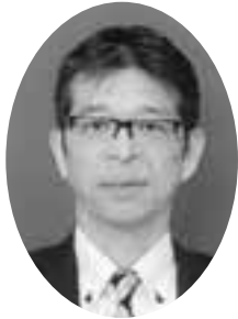
校長として着任して

平成二十七年六月十三日の第一回役員会において、平成二十六年度の事業報告、決算・監査報告、二十七年年度の行事・予算の審議又役員改選において満場一致で可決