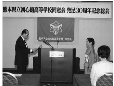
熊本県立湧心館高等学校同窓会 発足30周年記念総会