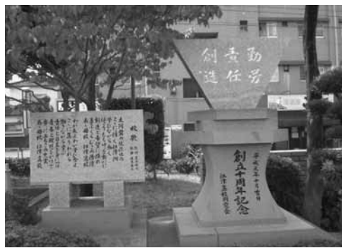
(きれいに清掃致しました)

これもひとえに学校当局のご理解と同窓会会員のみなさまのご支援の賜物と感謝申し上げます。この記念碑が在校生のシンボルとなつて、学校が益々発展することを願っております。